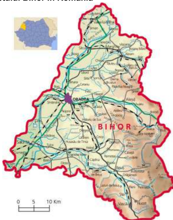
Figura 1 Locatia Judetului Bihor in Romania

Judetul Bihor este situat in partea de nord-vest a Romaniei, langa granita romano-ungara. Se invecineaza in partea de nord, nord-est cu judetele Satu-Mare si Salaj, la est cu judetul Cluj, la sud, sud-est cu judetele Arad si Alba. In partea de vest se invecineaza cu judetele Hajdu-Bihar si Békés din Ungaria avand astfel, zona de frontiera cu tara vecina pe o portiune de peste 150 km.