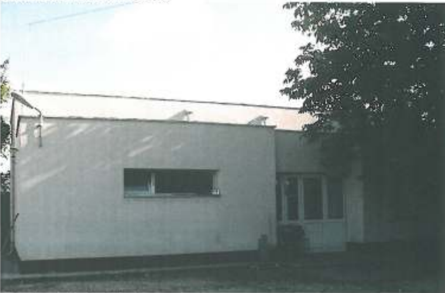
S.P. Zona Industrială