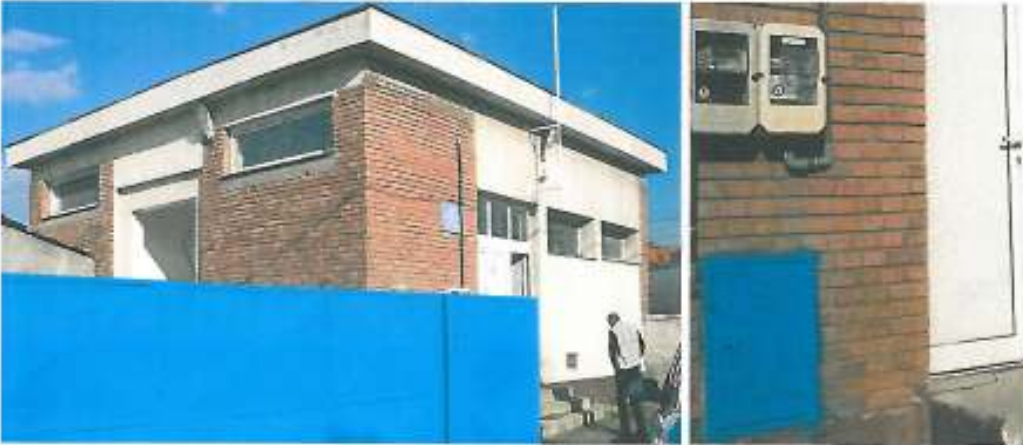
S.P. Tudor Vladimirescu