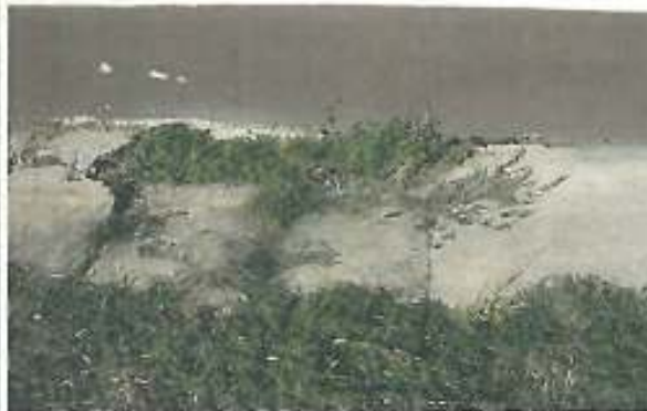
S.P. Tudor Vladimirescu

f) In toate cazurile documentele si inregistrarile de calitate aferente constructiei, sint incomplete, netraduse in limba oficiala a operatorului si organelor relevante de control ale statului, referintele dimensionale si calitative sint insuficiente si formatul de selectie si arhivare utilizat este de tip general-aplicabil in mediul investitional international, dar fara specificitatile prevazute de legislatia in vigoare – fapt corectat prin prezenta expertiza si solutiile de corijare continute.