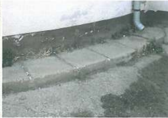
S.P. Iosia Nord