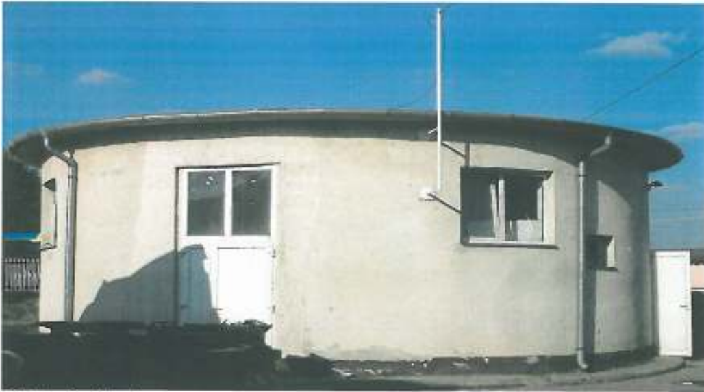
S.P. Iosia Nord